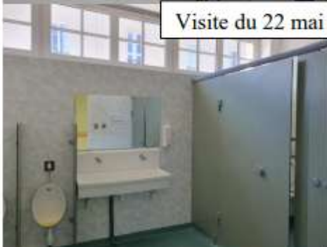
Visite du 22 mai